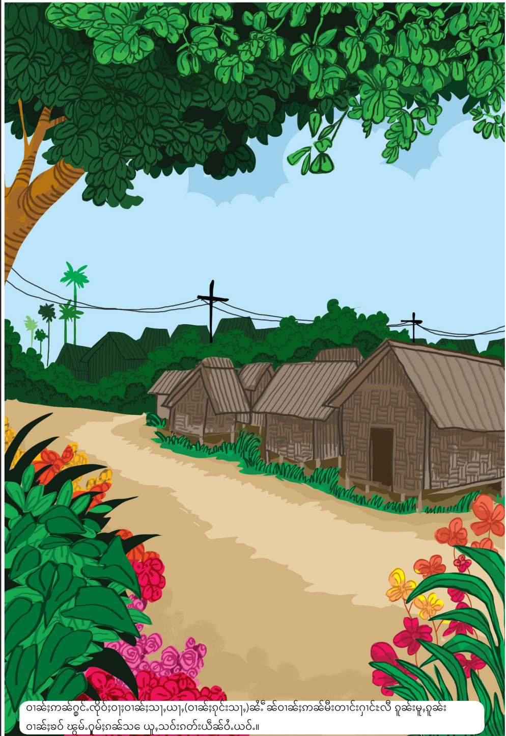
ဝါခင်းကန်ရွာငယ်ထဲမှာ ဝါခင်းရင်းသား၊ ဝါခင်းရင်းသား၊ (ဝါခင်းရင်းသား) ဆိုတဲ့ ဝါခင်းကန်မီးတိုင်းရှာဖွေဖို့ ရှာဖွေမှု၊ ရှာဖွေမှု ဝါခင်းခပ် ဗွမ်၊ ရှာဖွေခပ်သေ ယူသွင်းတတ်ယိုခပ်ပိယပ်။။