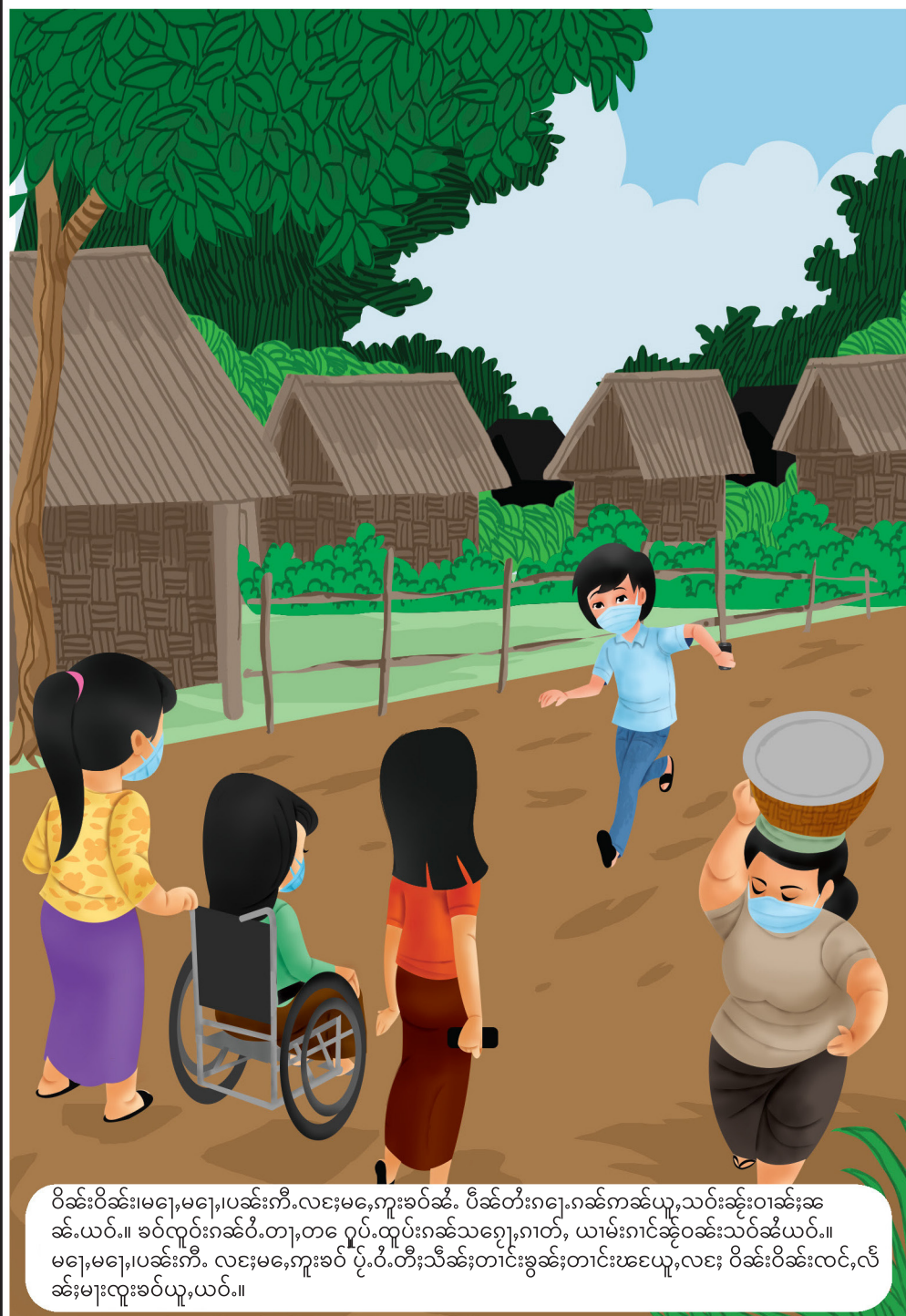
ဝါခင်းဝါခင်းမေ့မေ့၊ ပါခင်းကီလေးမေ့မေ့၊ ခပ်ခပ် ပီခင်းတီးဂေ့၊ ဂေ့ကန်ယူသွင်းခင်းဝါခင်းဆ ခင်းယပ်။။ ခပ်လှိုင်းဂေ့ဝိတျာ၊ တေ့ ဂွပ်ထုပ်ဂေ့သေ့၊ ဂတ်၊ ယာမ်းဂေ့ခင်းသွင်းခပ်ယပ်။။ မေ့မေ့၊ ပါခင်းကီလေးမေ့မေ့၊ ဝိတီးသီခင်းတိုင်းခွမ်းတိုင်းဖေ့ယူလေး၊ ဝါခင်းဝါခင်းလင်၊ လီ ခင်းမီးလှိုင်းခပ်ယူယပ်။။