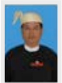
ဦးဝင်းကို အဖွဲ့ဝင်