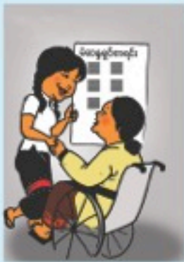
မဲစာရင်းတွင် မိမိအမည် မပါ/မပါ ရပ်ကွက်/ကျေးရွာ ကော်မရှင်ရုံးတွင် သွားရောက်ကြည့်ရှုပါ

ဤပန်းတိုင်သည်ပူးပေါင်းပါဝင်မှုကိုတိုးပွားစေပြီး၊ ဒီမိုကရေစီ ယဉ်ကျေးမှုထွန်းကားရန် အထောက်အကူဖြစ်စေသည်။ ထိရောက်ပြီး ကောင်းမွန်သည့် ပြည်သူနှင့်မဲဆန္ဒရှင်ပညာပေး အစီအစဉ်များက ပို၍ တက်ကြွပြီး အဓိပ္ပါယ်ရှိသည့်ပူးပေါင်းပါဝင်မှုကိုဖြစ်ပေါ်စေသည်။