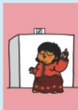
သက်ဆိုင်ရာ လွှတ်တော်တစ်ရပ်စီအတွက် ဆန္ဒမဲတစ်မဲသာပေးပိုင်ခွင့်ရှိသည်