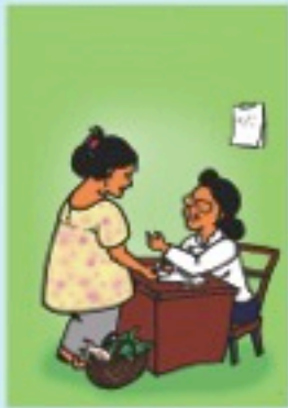
မိမိအမည်မပါလျှင် ရပ်ကွက်/ကျေးရွာ ကော်မရှင်ရုံးသို့ မိမိအမည်စာရင်း ထည့်သွင်းပေးရန် တောင်းဆိုပါ