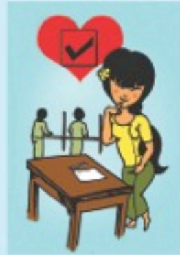
သင်နှစ်သက်ရာ ကိုယ်စားလှယ်လောင်း၏ အမည်နှင့် သင်ကတော့ဘယ်ဘက်တွင်ရှိသော လေ့ထောင်ကွက်အတွင်းတွင် (✓) အမှတ်အသားပြု၍ မဲပေးပါ