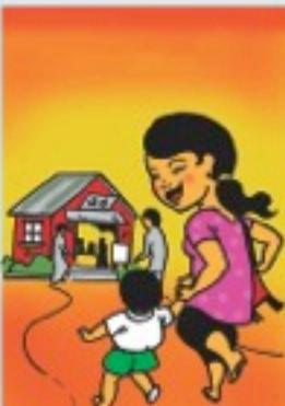
မဲရုံသို့ နံနက်(၆)နာရီမှ ညနေ(၄)နာရီ အချိန်အတွင်း သွားရောက်မဲပေးပါ