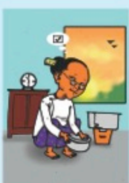
ရွေးကောက်ပွဲကွင်းပသည်နေ့တွင် မိမိအမည်စာရင်းပါသည့် မဲရုံတွင်သာမဲပေးရမည်